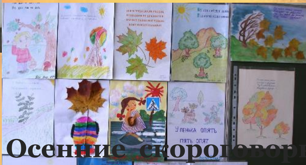
Осенние скороговорки 1 «Г» класса