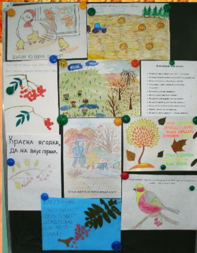
Осенние приметы от 2 «Г» класса