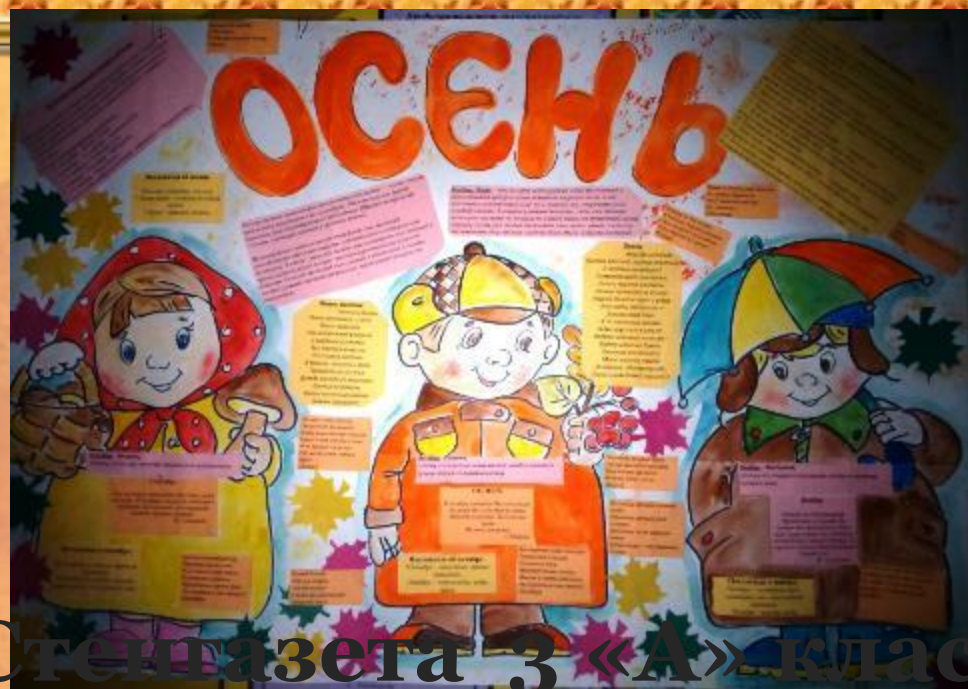
Стенгазета 3 «А» класса