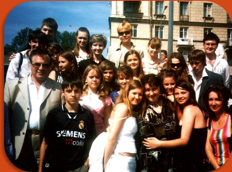
Выпуск 2007 – 9 класс