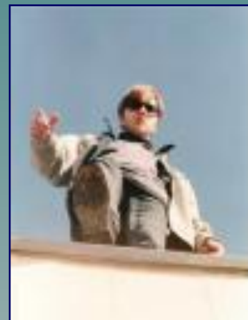
шаг в бездну...