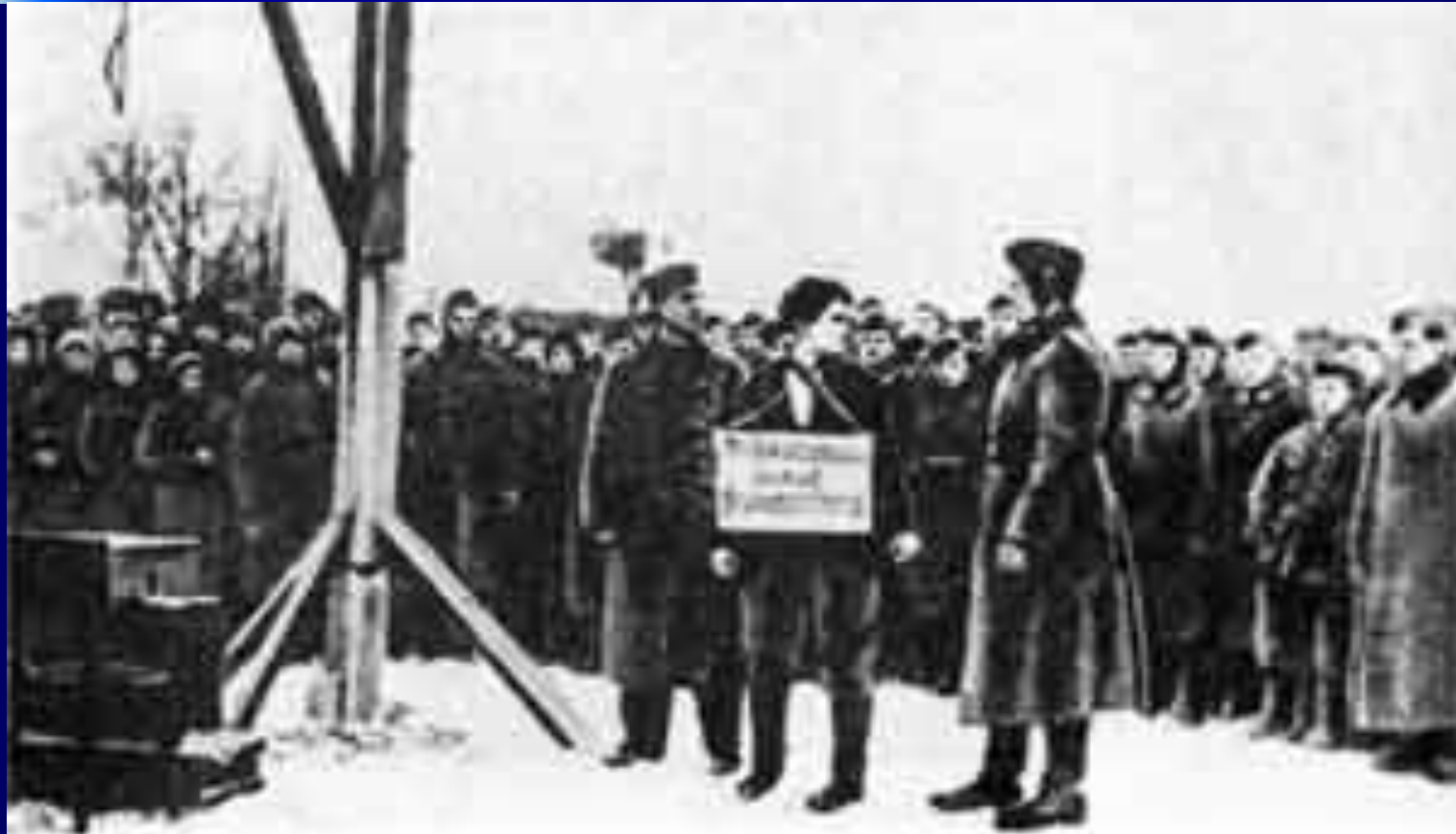
Зоя Космодемьянская перед казнями. Деревня Петришино, зима 1941 г. Репродукция со штампа немецкого офицера.

Смело действовали под Москвой в тылу врага партизаны Калининской области. Как раз в эти дни совершили свои бессмертные подвиги комсомольцы Зоя Космодемьянская, Саша Чекалин и сотни других.