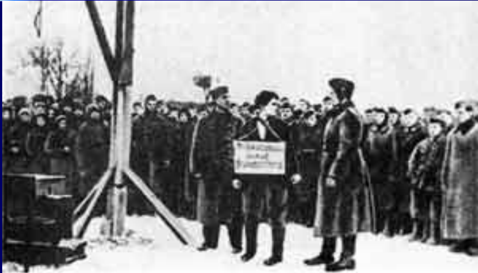
Зоя Космодемьянская перед казнями. Деревня Петришино, зима 1941 г. Репродукция со снимка немецкого офицера.

Смело действовали под Москвой в тылу врага партизаны Калининской области. Как раз в эти дни совершили свои бессмертные подвиги комсомольцы Зоя Космодемьянская, Саша Чекалин и сотни других.