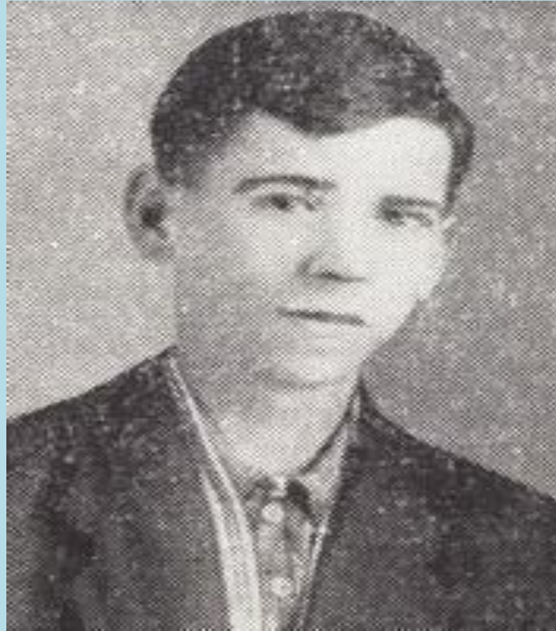
Василий Галактионович Шелест