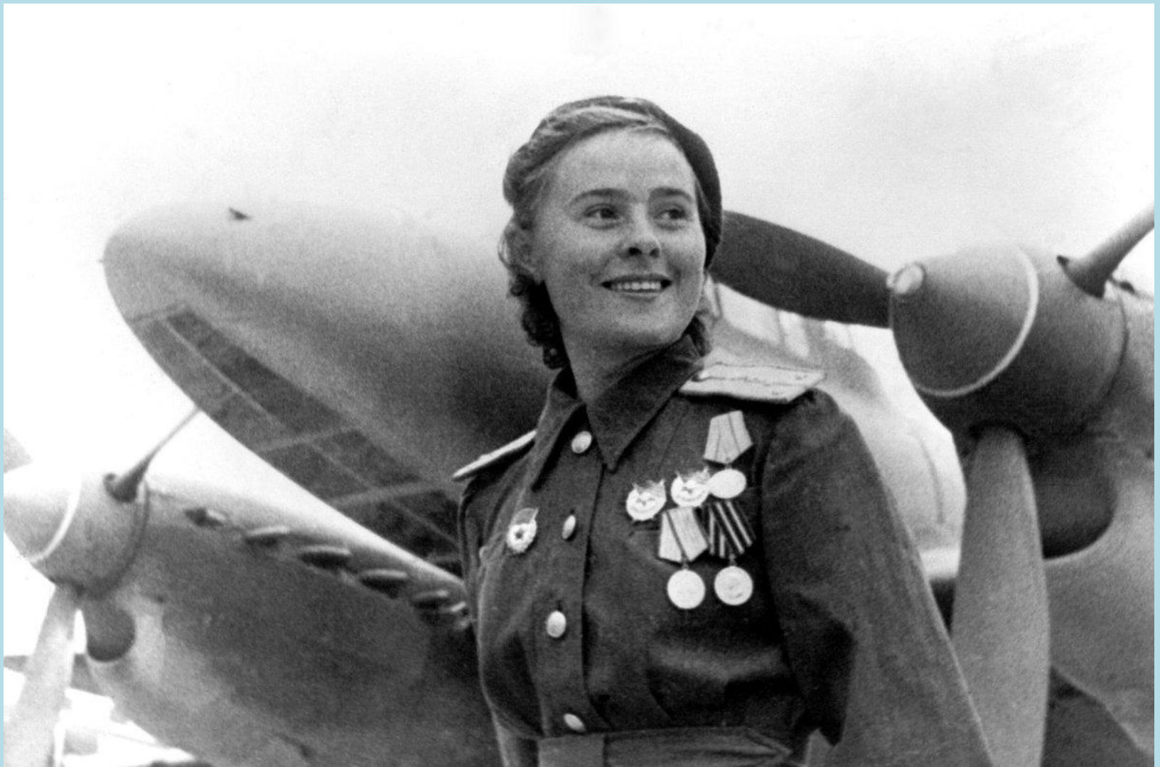
Лидия Литвяк - «Белая лилия Сталинграда».