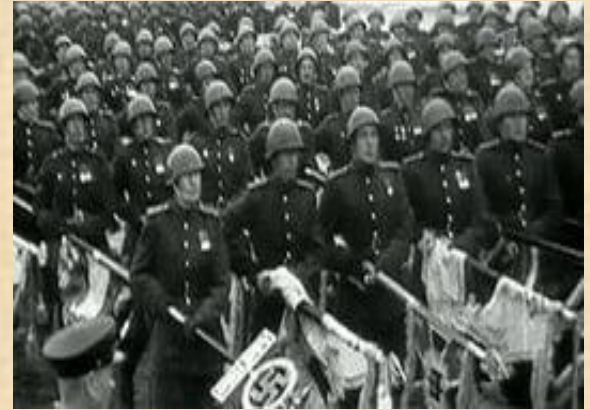
(Парад в Москве)