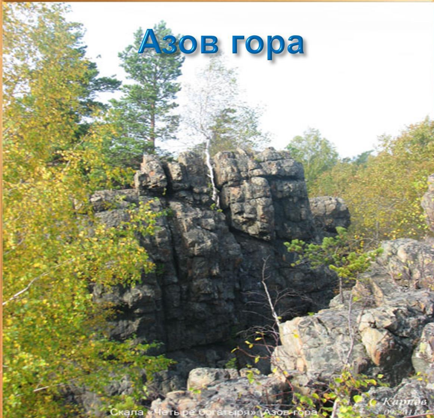
Скала «Четыре богатыря» (Азов гора)