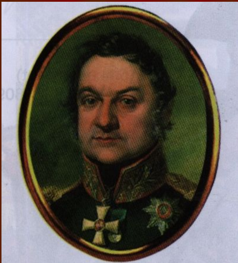
Генерал от инфантерии Дмитрий Сергеевич Дохтуров