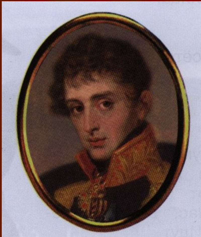
Генерал-майор Александр Алексеевич Тучков 4-й