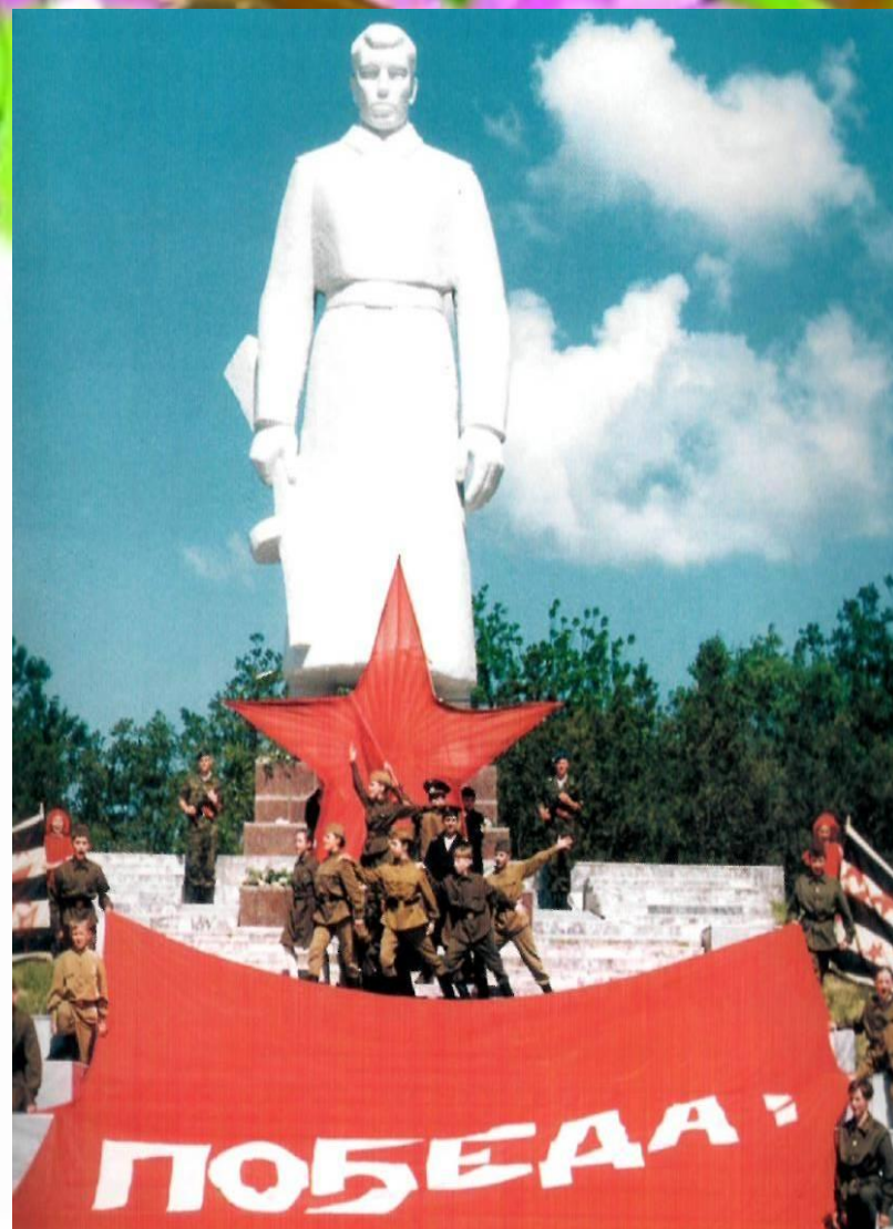
Крымский район, «Сопка героев»