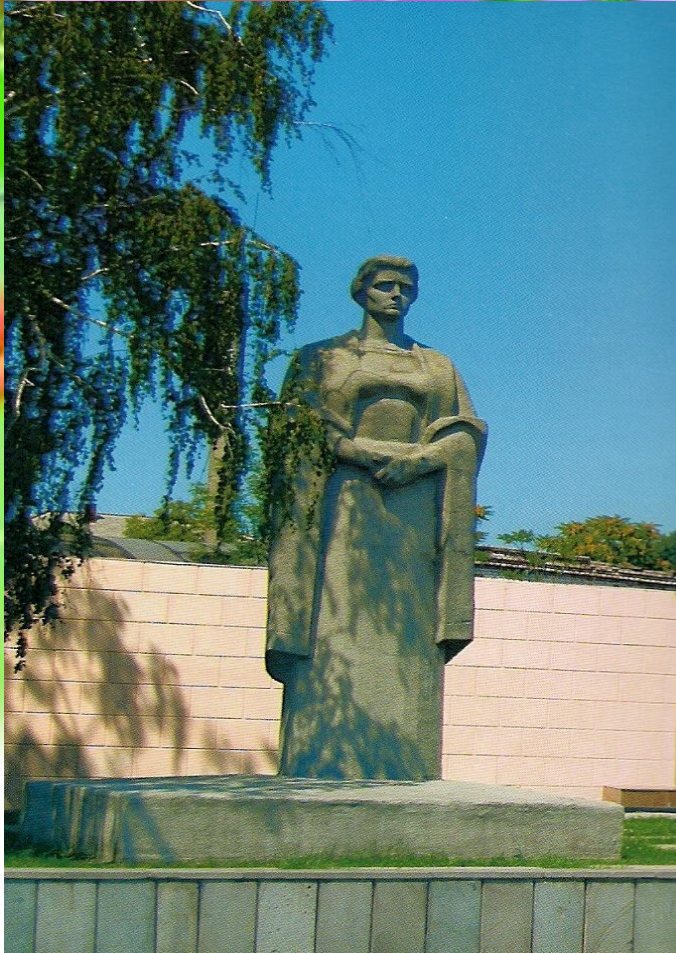
Г. Краснодар, Площадь Памяти Героев.