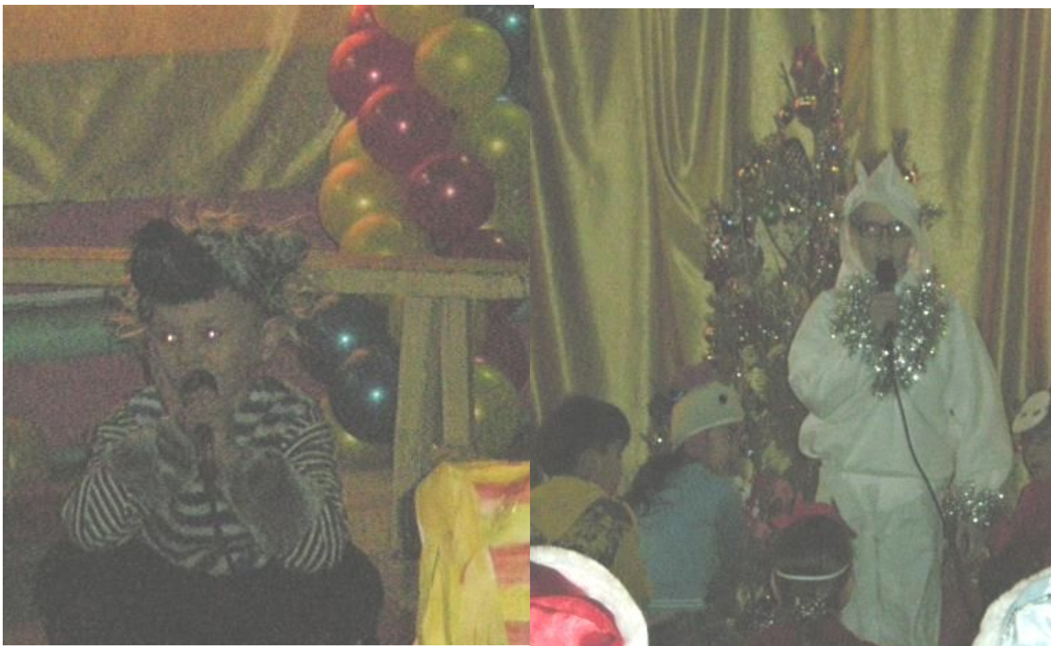
Два друга волк и козленок