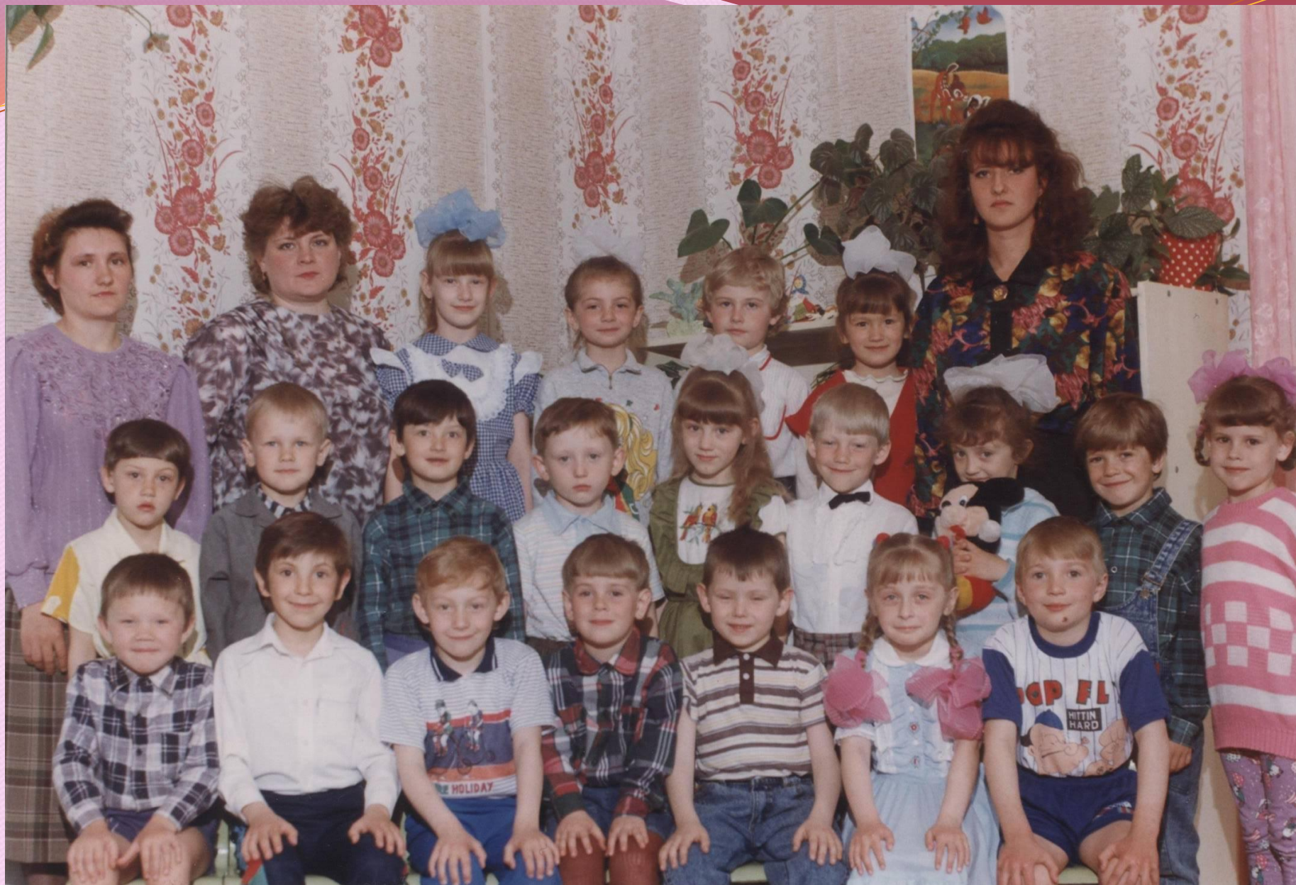
Красноярский край, пгт. Козулька, Д/С «Светлячок». Выпуск 1996 года.