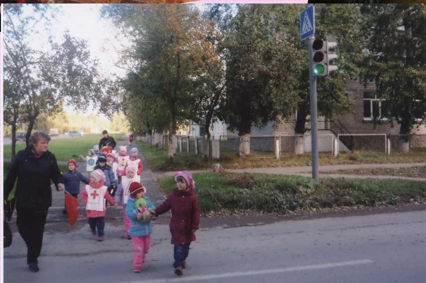
Свердловская область, г. Верхняя Пышма, МДОУ №17 «Радость»