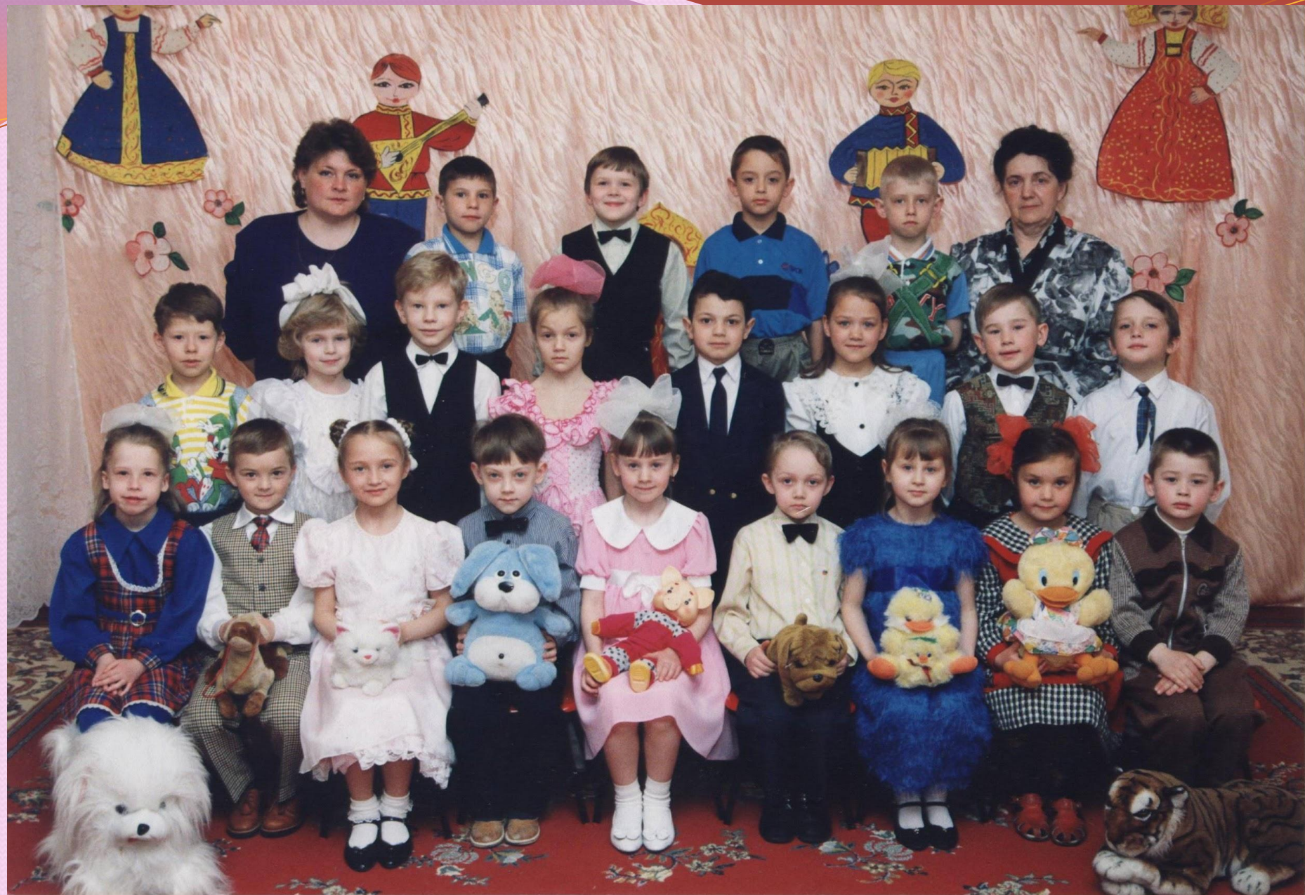
Свердловская область, г. Верхняя Пышма, МДОУ №11 «Петушок», Выпуск 2000 года