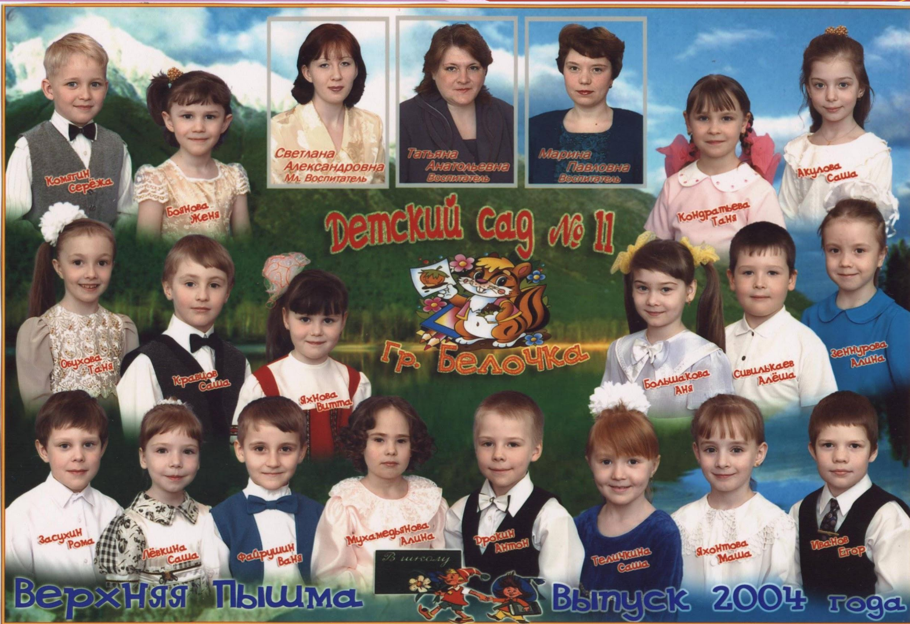
Свердловская область, г. Верхняя Пышма, МДОУ №11 «Петушок», Выпуск 2004 года