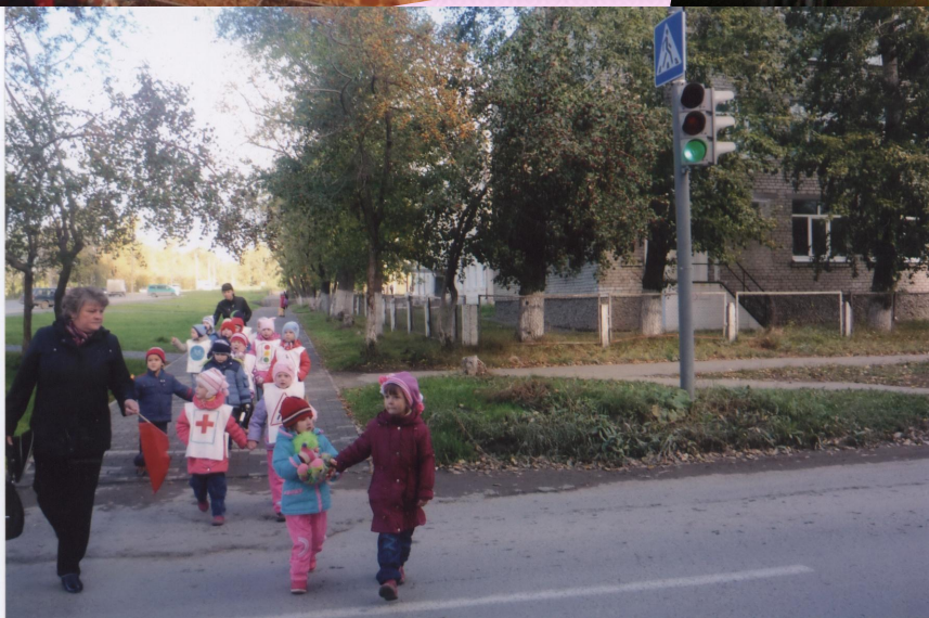
Свердловская область, г. Верхняя Пышма, МДОУ №17 «Радость»