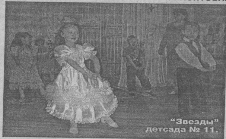
«Звезды» детсада № 11.