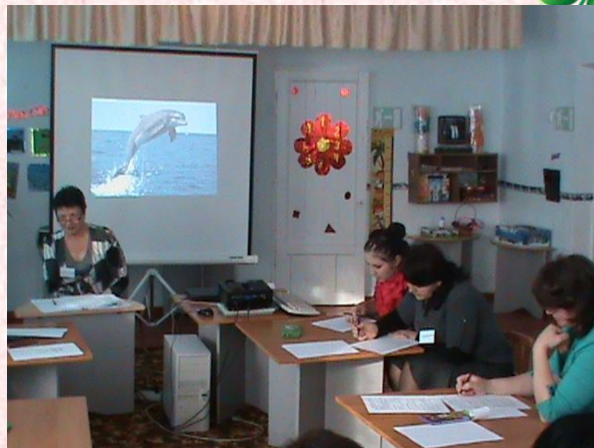
Семинар ИКТ технологий в ДОУ