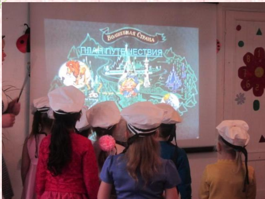
Занятие с применением ИКТ технологий