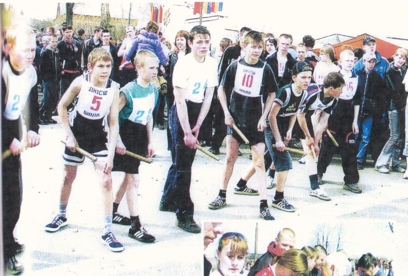
На старте – наши надежды