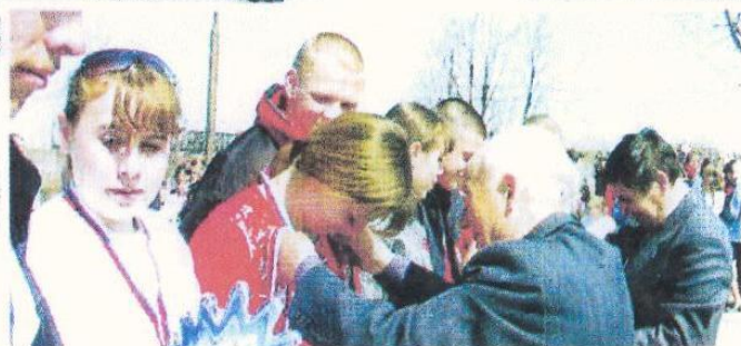
Районная Л/А эстафета, посвящённая Дню Победы 8кл.