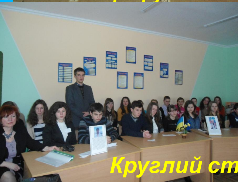
Круглий стіл в пам'ять Небесній