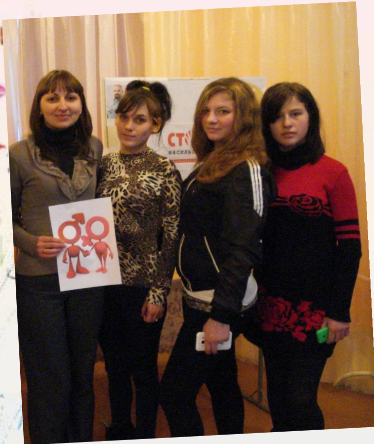
Тренінгове заняття «Станція призначення –життя»