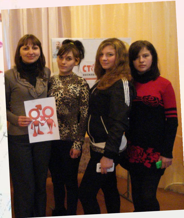
Тренінгове заняття «Станція призначення –життя»