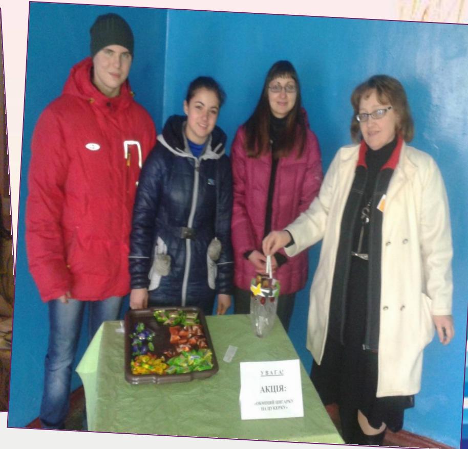
Акція «Обміняй цигарку на цукерку»