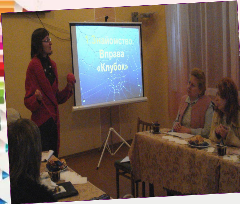
Тренінг «Формування керованої поведінки особистості підлітка» для вихователів