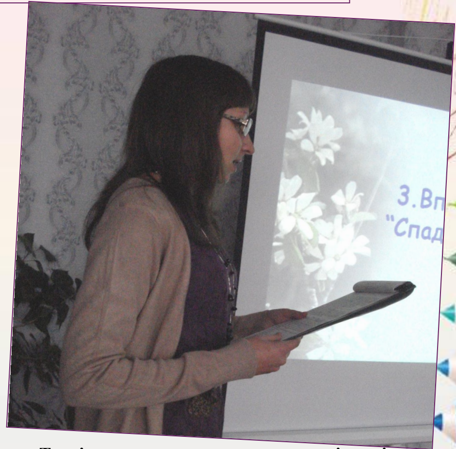
Тренінгове заняття для класних керівників «Конфліктологічна компетентність як складова професійної культури класного керівника»