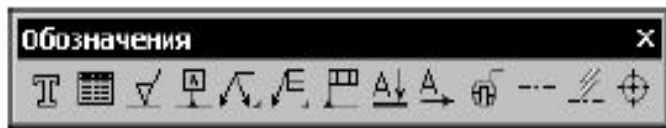
Рис. 27.1. Панель Обозначения

Команды простановки обозначений сгруппированы в меню Инструменты — Обозначения , а кнопки для вызова команд — на панели Обозначения (рис. 27.1).