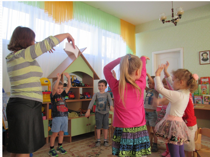
«Иголлка, нитка, узелок»