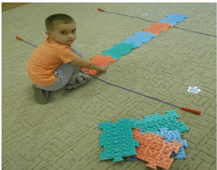
« Перепрыгни через ров»