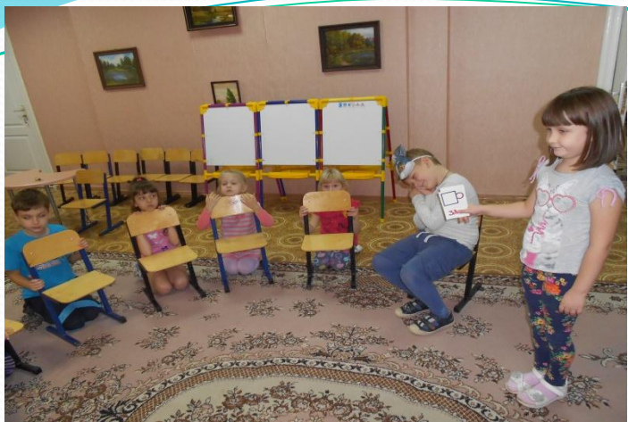
«Кот и мыши»