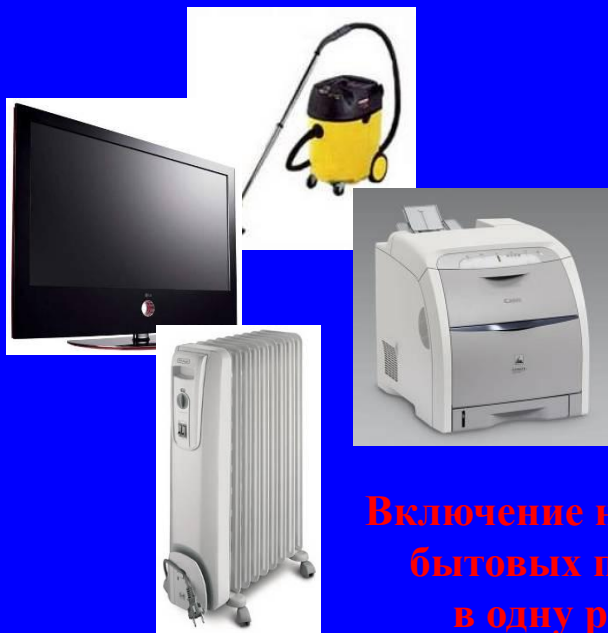
Включение нескольких бытовых приборов в одну розетку