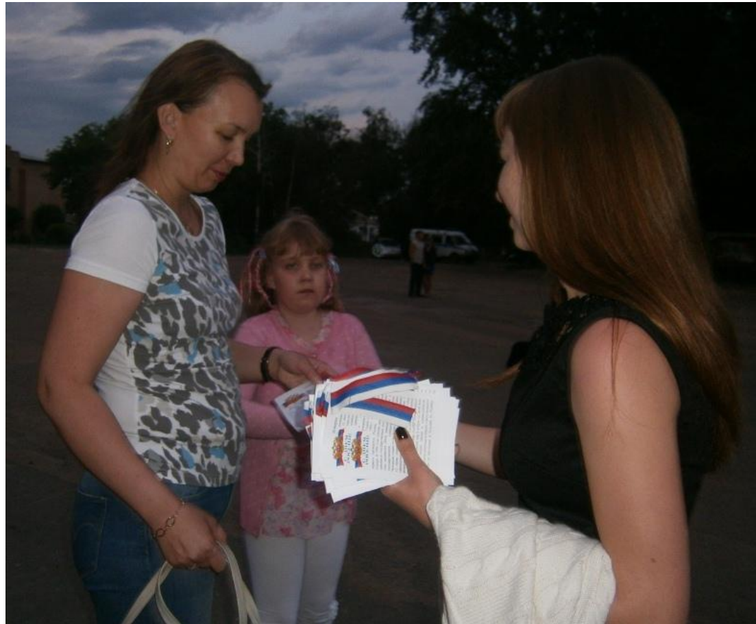
Участие в акции «Символы России»