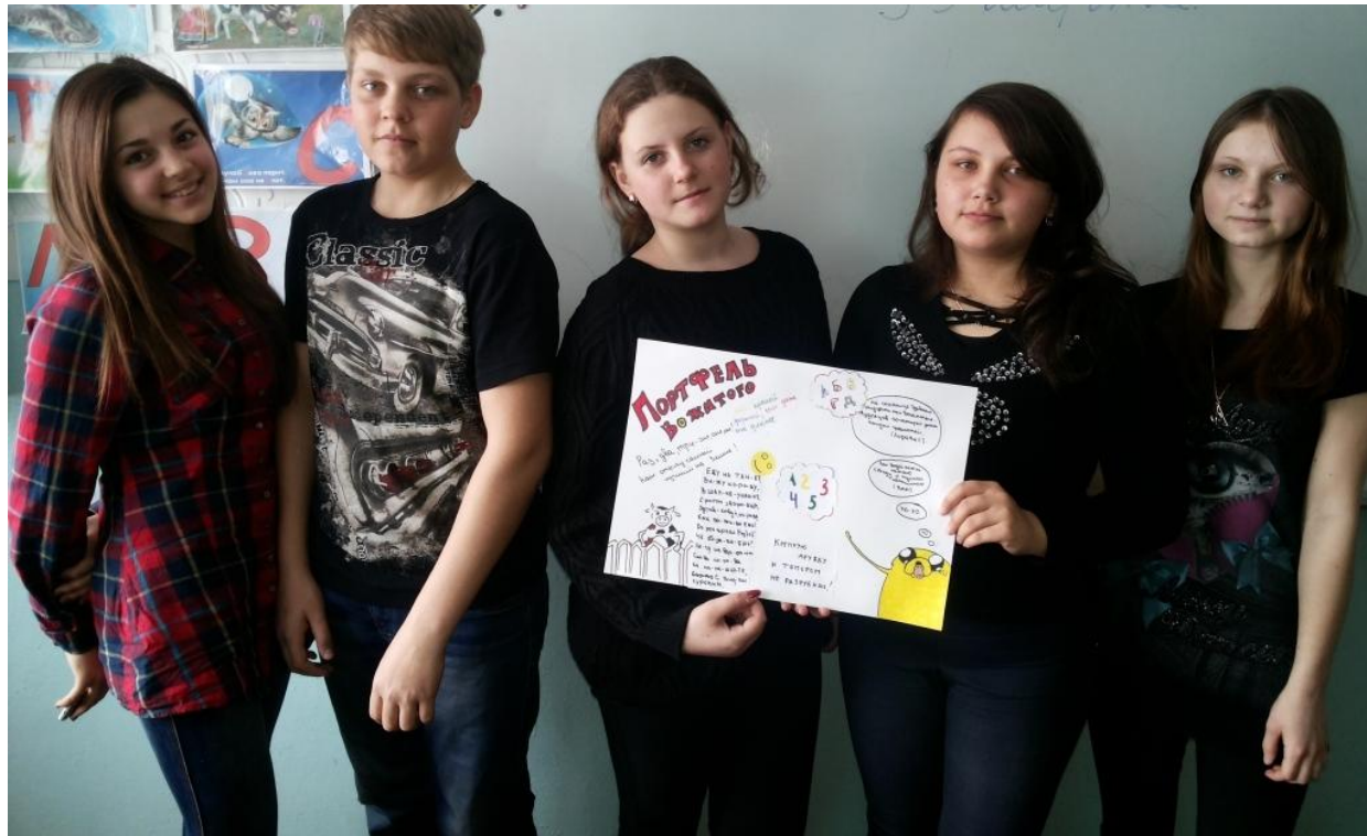
Оформительский практикум «Портфель водителя»