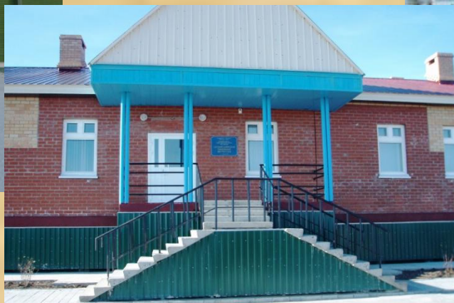
«Сюнай-Салинская начальная школа-сад»