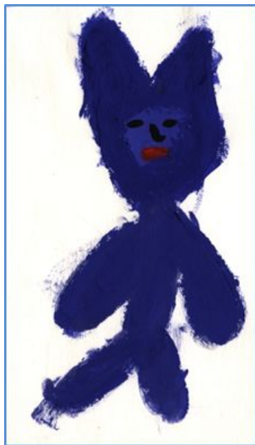
Рисунок «Моё ласковое имя».