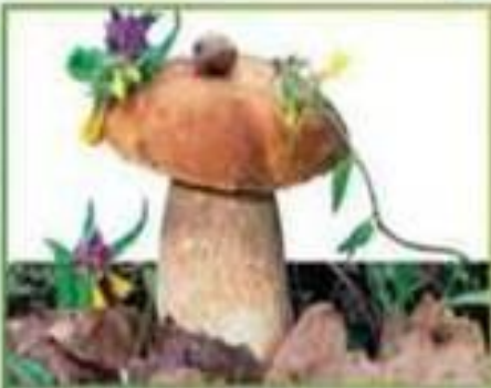
белый гриб (еловый)