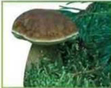
белый гриб (сосновый)