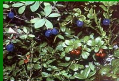
черника и брусника