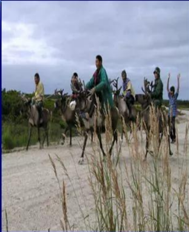
Гонки на оленях