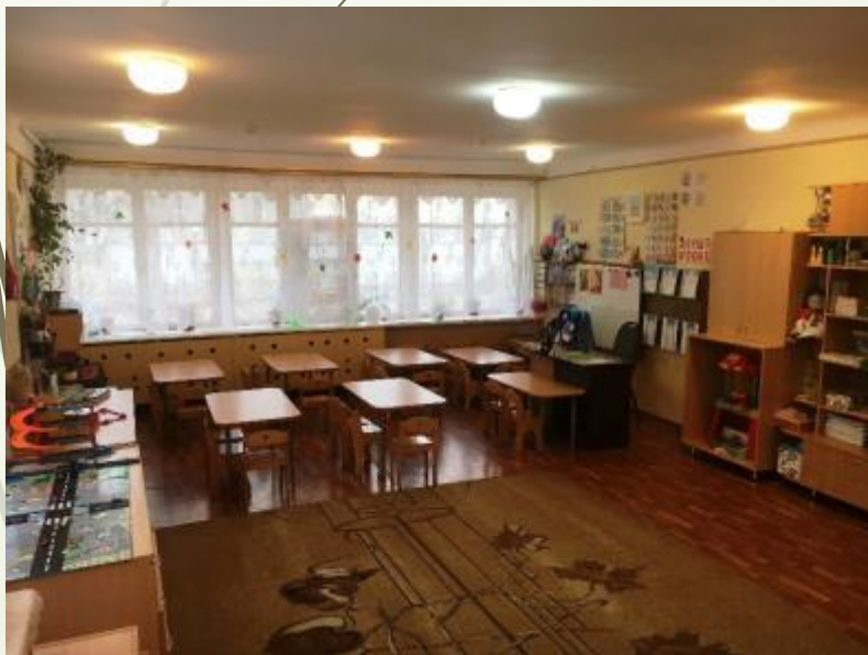
Верхняя левая точка