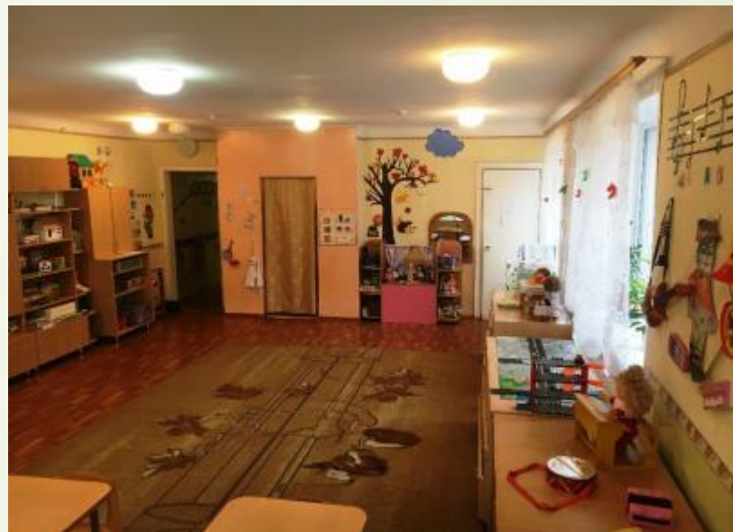
Нижняя левая точка