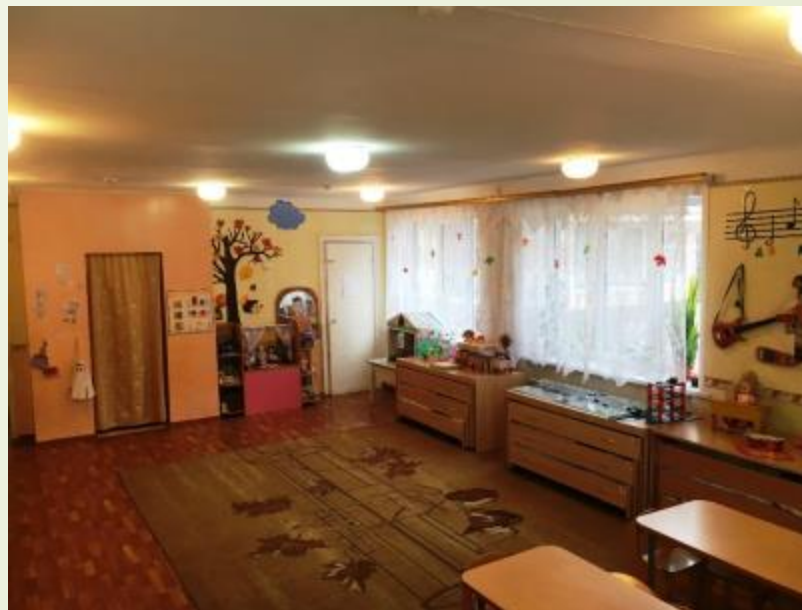
Верхняя правая точка