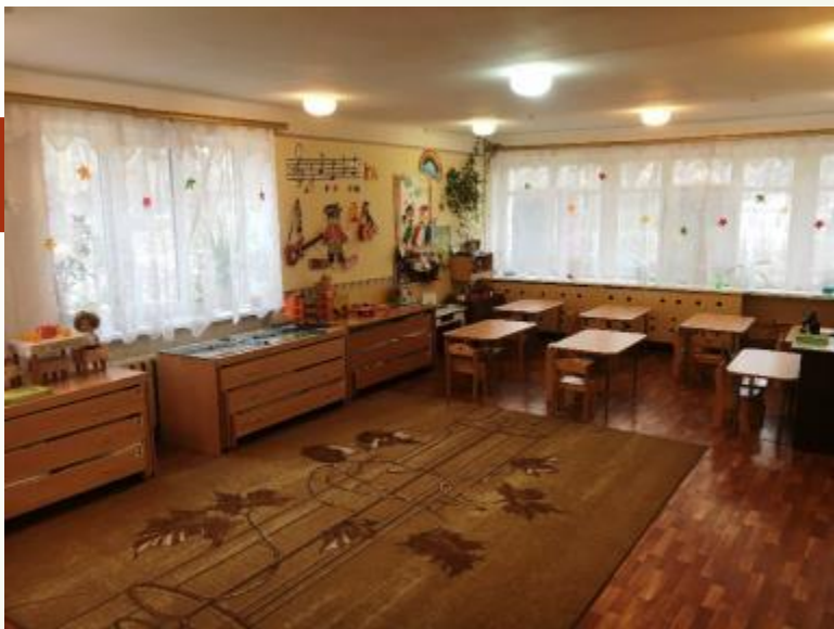
Вход в группу нижняя правая точка