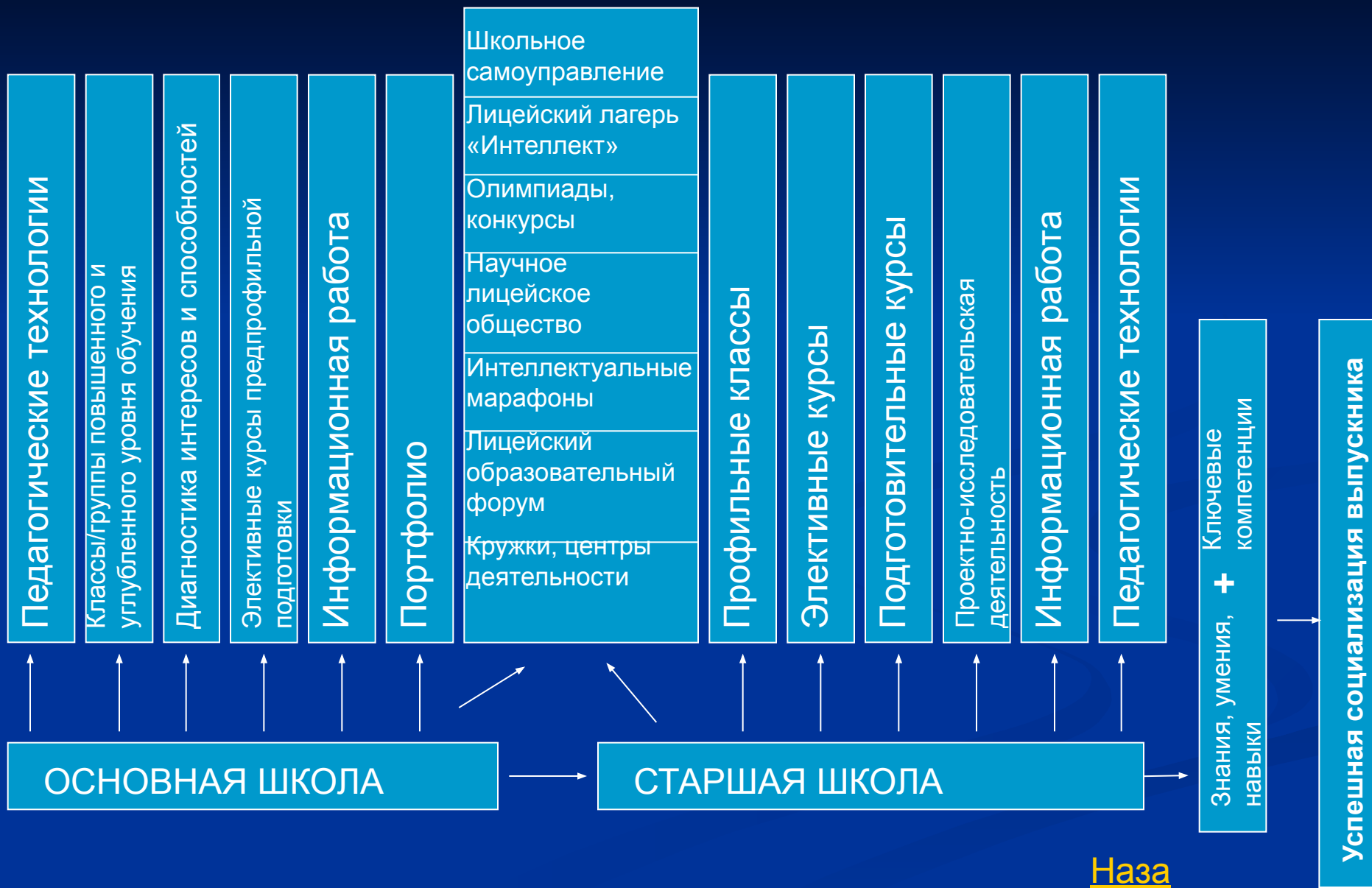
Схема профильного обучения в лицее № 1