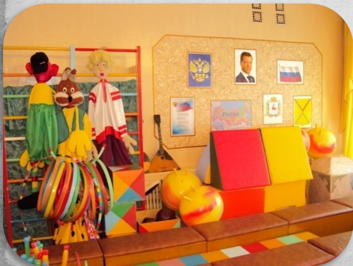
Зал физической культуры