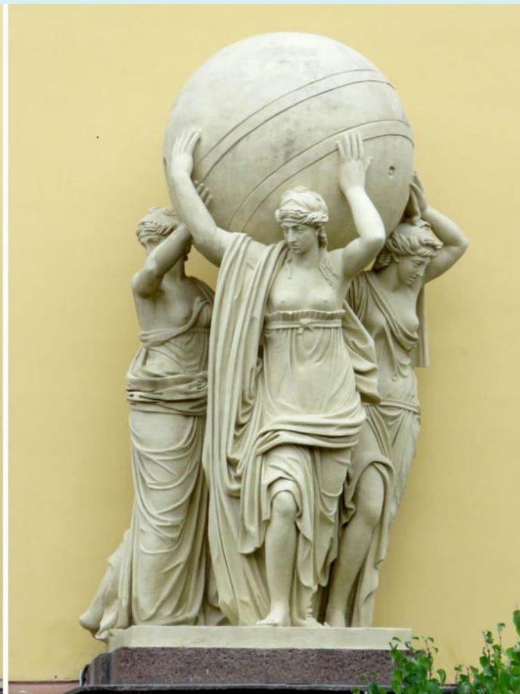
Морские нимфы, несущие земную сферу