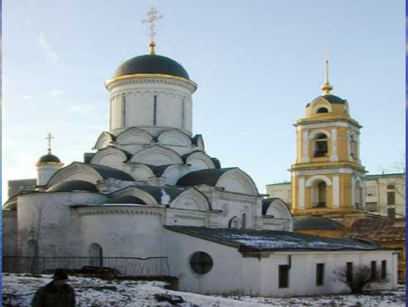
Храм Рождества Пресвятой Богородицы в Звенигороде