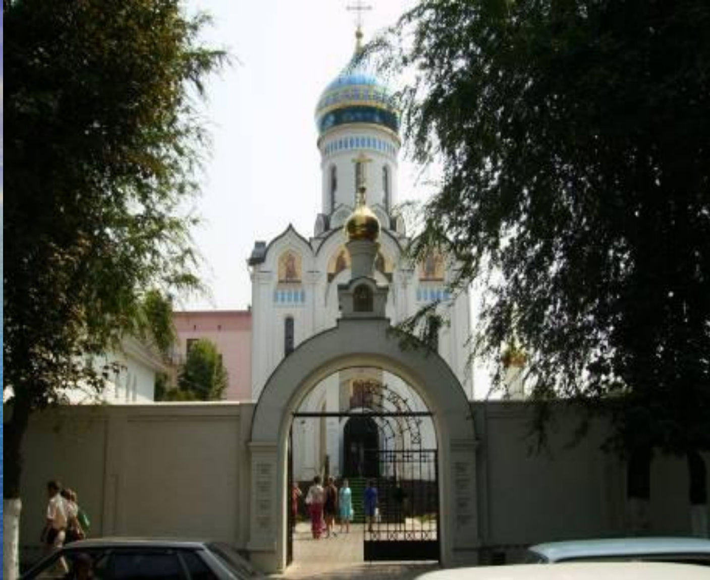
Храм Всецарицы в г. Краснодаре.