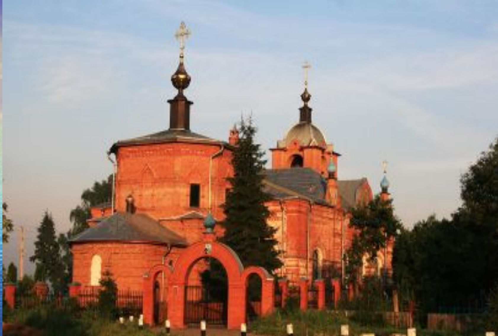
Церковь рождества Пресвятой Богородицы в селе Иван-Теремец Московской области