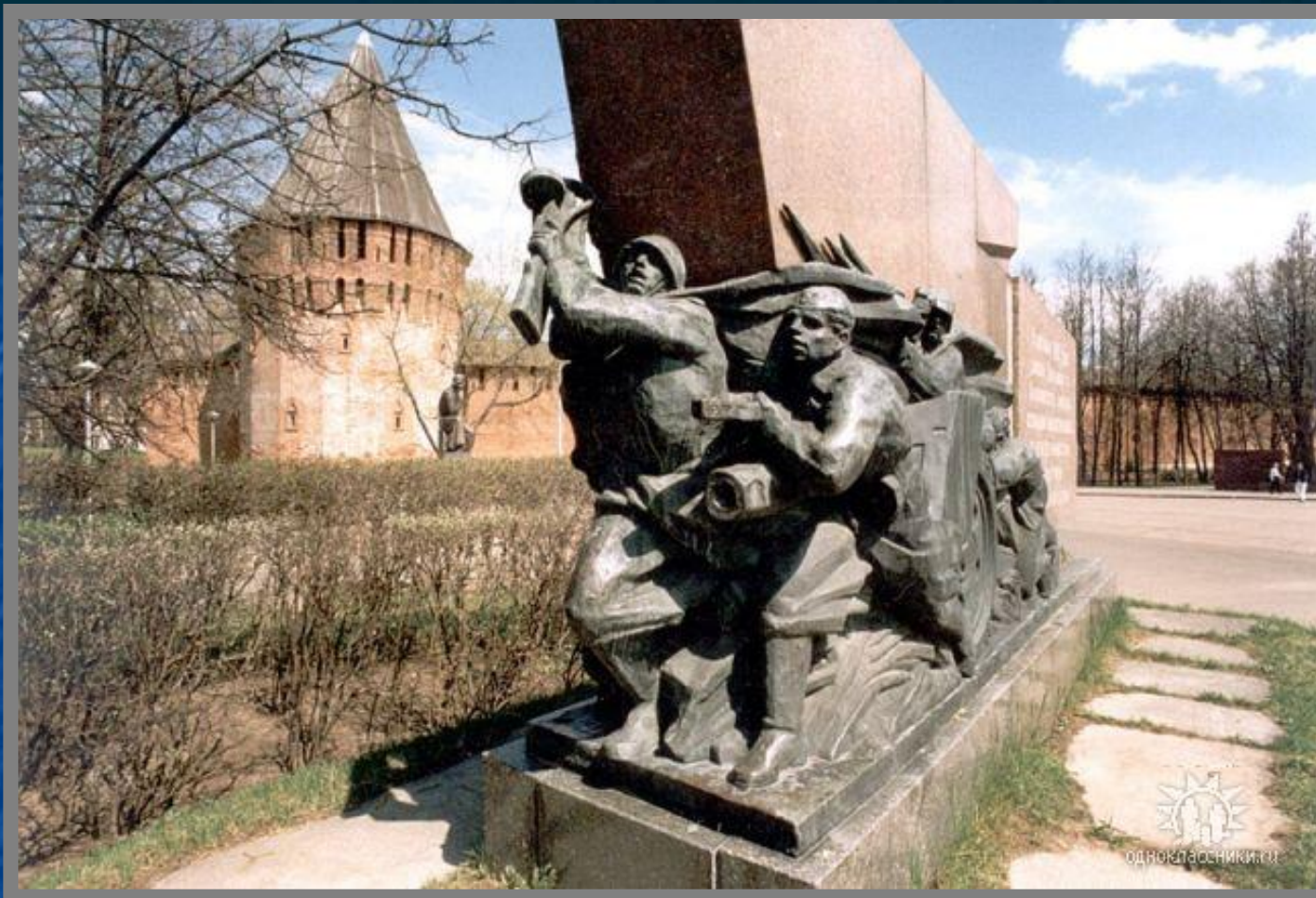
Мемориальный знак Защитникам города в войне 1941- 1945г.г.