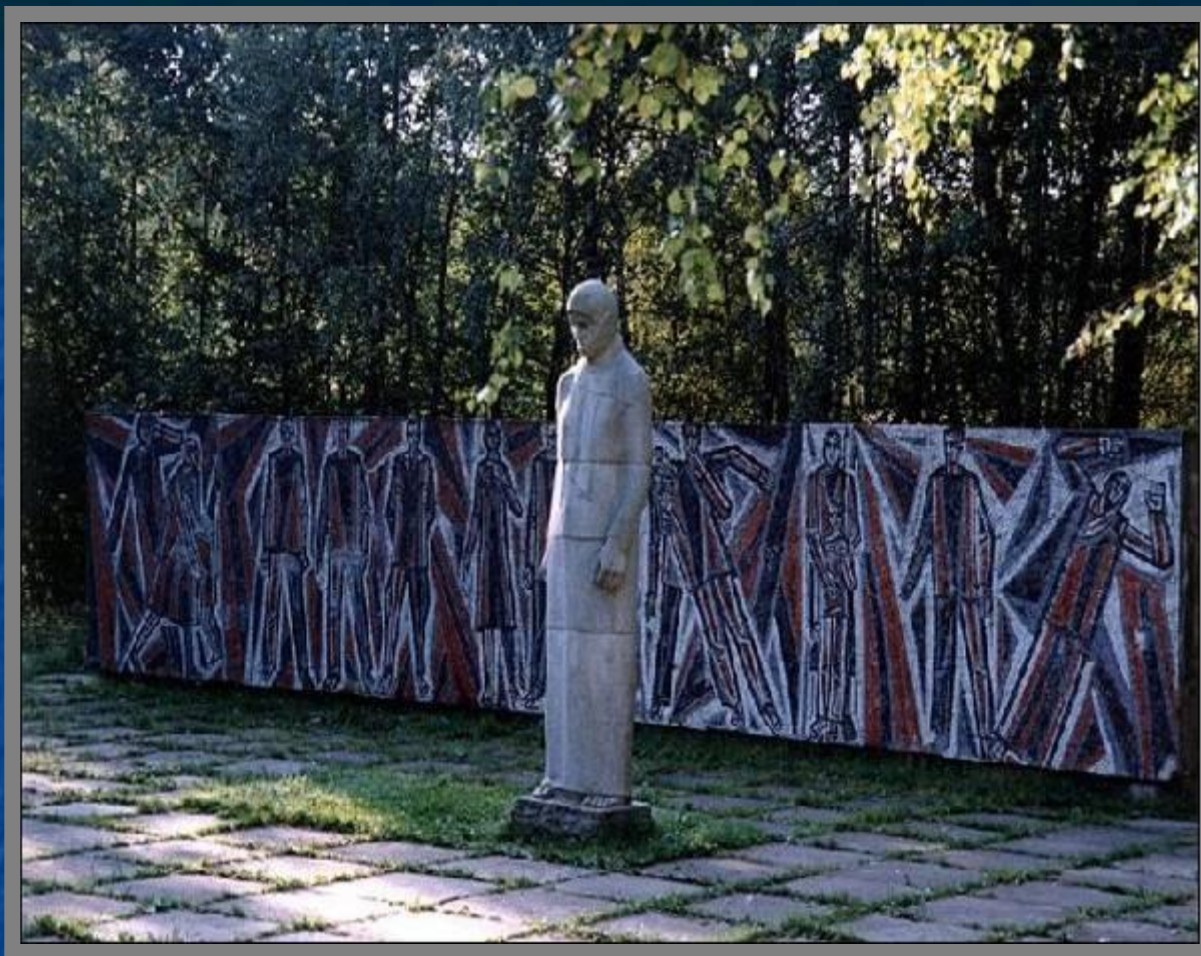
Памятник-надгробие Скорбящая Мать