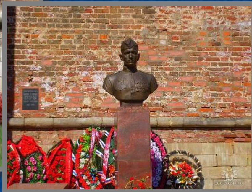
Бюст Героя Советского Союза М.А.Егорова