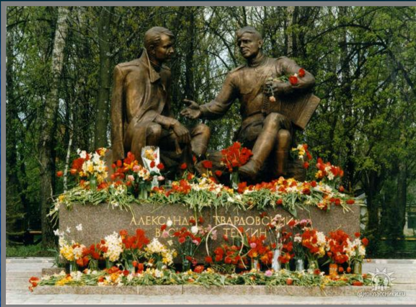
Памятник А.Т.Твардовскому и Василию Тёркину