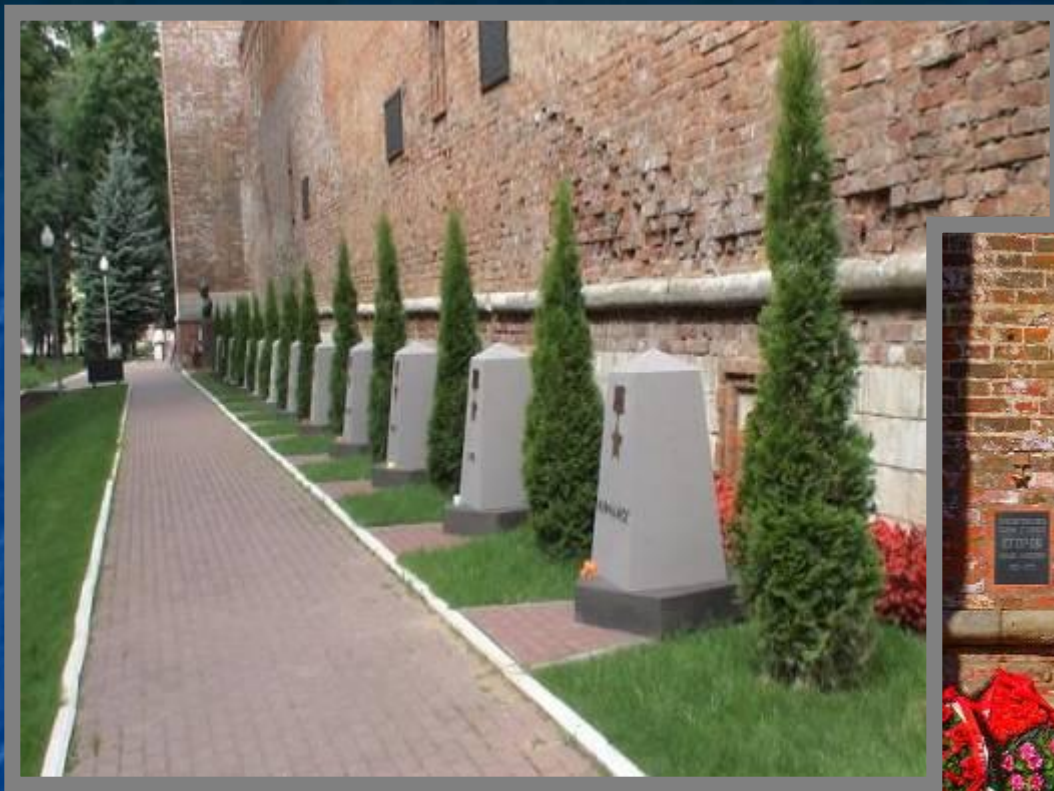
Сквер памяти героев 41 плита - 41 могила Здесь захоронены 4 Героя Советского Союза