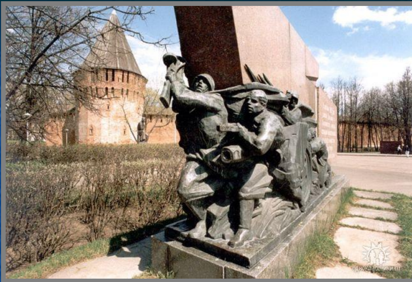
Мемориальный знак Защитникам города в войне 1941- 1945г.г.