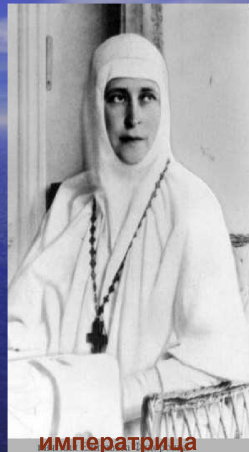
императрица Мария Федоровна

Учредила госпитали в Минске, Киеве, Тифлисе, она приглашает на добровольных началах вдов и направляет их в Санкт-Петербургскую больницу для "прямого назначения как ходить и смотреть за больными". После присяги каждой был вручен особый знак золотой крест, на одной из сторон которого было написано " Сердоболие ". Высокие моральные качества, служение страдающим людям становится традицией русских сестер милосердия.