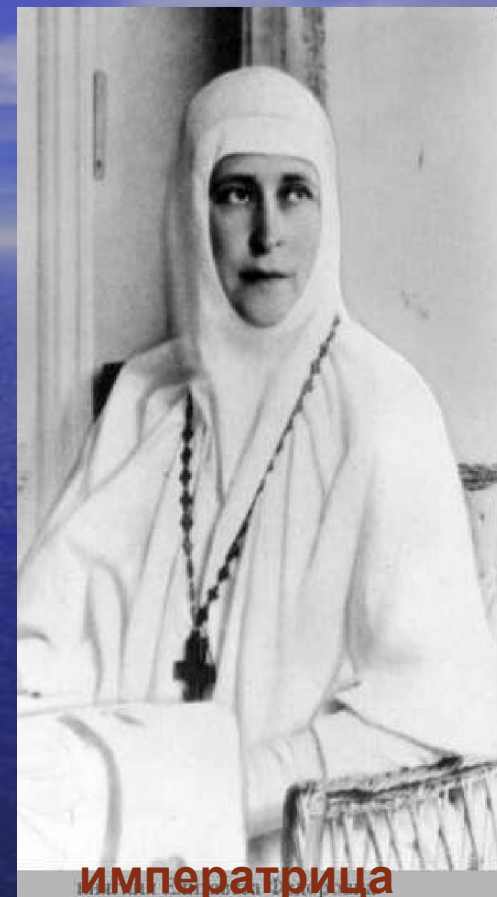
императрица Мария Федоровна

Учредила госпитали в Минске, Киеве, Тифлисе, она приглашает на добровольных началах вдов и направляет их в Санкт-Петербургскую больницу для "прямого назначения как ходить и смотреть за больными". После присяги каждой был вручен особый знак золотой крест, на одной из сторон которого было написано " Сердоболие ". Высокие моральные качества, служение страдающим людям становится традицией русских сестер милосердия.