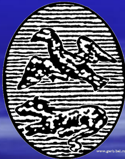
Герб Белгородской губернии (создан: Белгородский и Киевский губернии). XVIII век.

При губернаторе Трубецком был утвержден первый белгородский губернский герб, удостоенный "высочайшей апробации" 3 марта 1730 года.