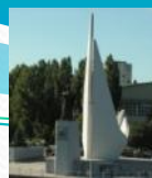
1- Памятник Николаю Чудотворцу, г. Калининград, Набережная Петра Великого