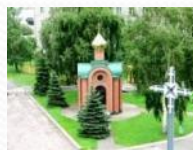
6- Часовня Святителя Николая, г. Калининград, Рыбный порт