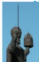
7- Памятник Николаю Чудотворцу, г. Калининград, Набережная Петра Великого