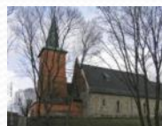
3- Святоニコльскый собор (бывшая Одиттен кирха), ул. Тенистая аллея