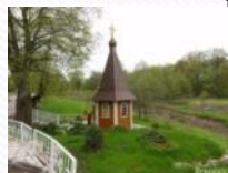
5- Святой источник Николая Чудотворца, Калининградская область, Зеленоградский район, пос. Мельниково