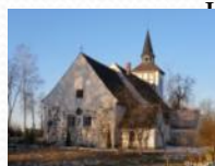
4- Кирха Святого Николая (бывшая кирха Heiligenwalde) Гурьевский район, поселок Шаково – 24 км Гвардейской трассы