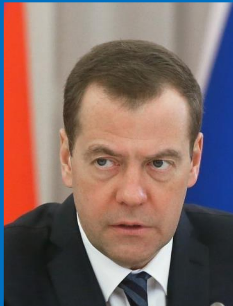
Председатель Правительства Д.А. Медведев