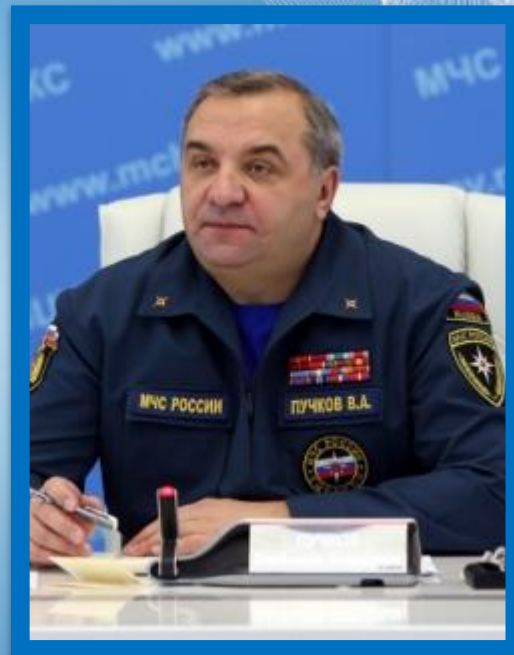
Министр РФ по делам ГО ЧС и ликвидации последствий стихийных бедствий