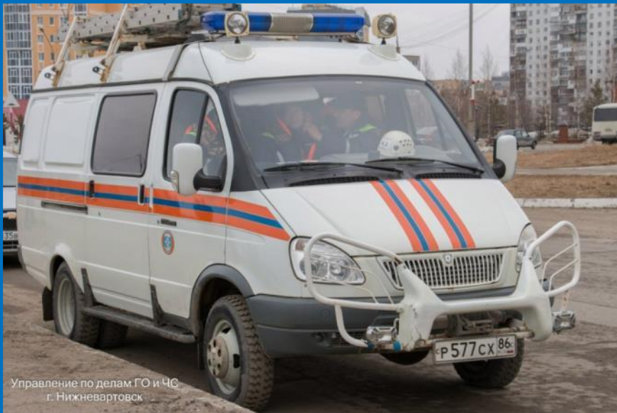
Управление по делам ГО и ЧС г. Нижневартовск