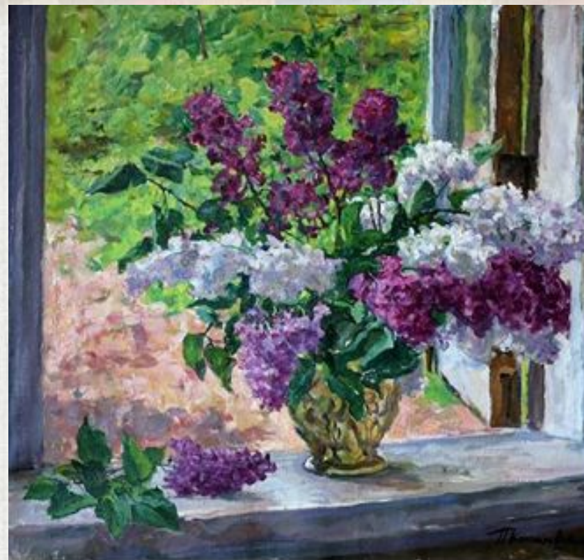
К. Петров-Водкин «Сирень у окна»