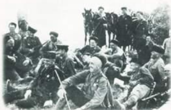
Бойцы 4-го Кубанского гвардейского кавалерийского корпуса на привале. 1942 г.