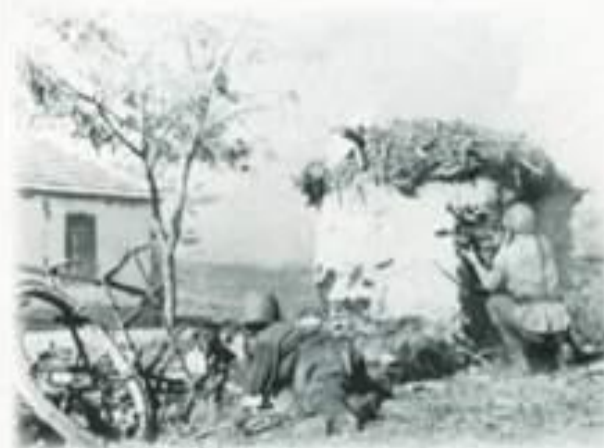
Атака. Кубань, 1943 г.