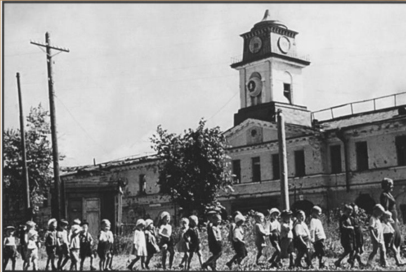
В Колпине открылся детский сад для детей фронтовиков и рабочихИжорского завода. На снимке: дети на прогулке. Июль 1944 г.