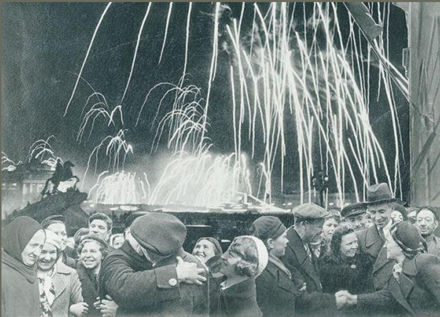
«Великая победа одержана советскими войсками под Ленинградом:

Великая победа одержана советскими войсками под Ленинградом 27 января 1944г. – полное снятие блокады