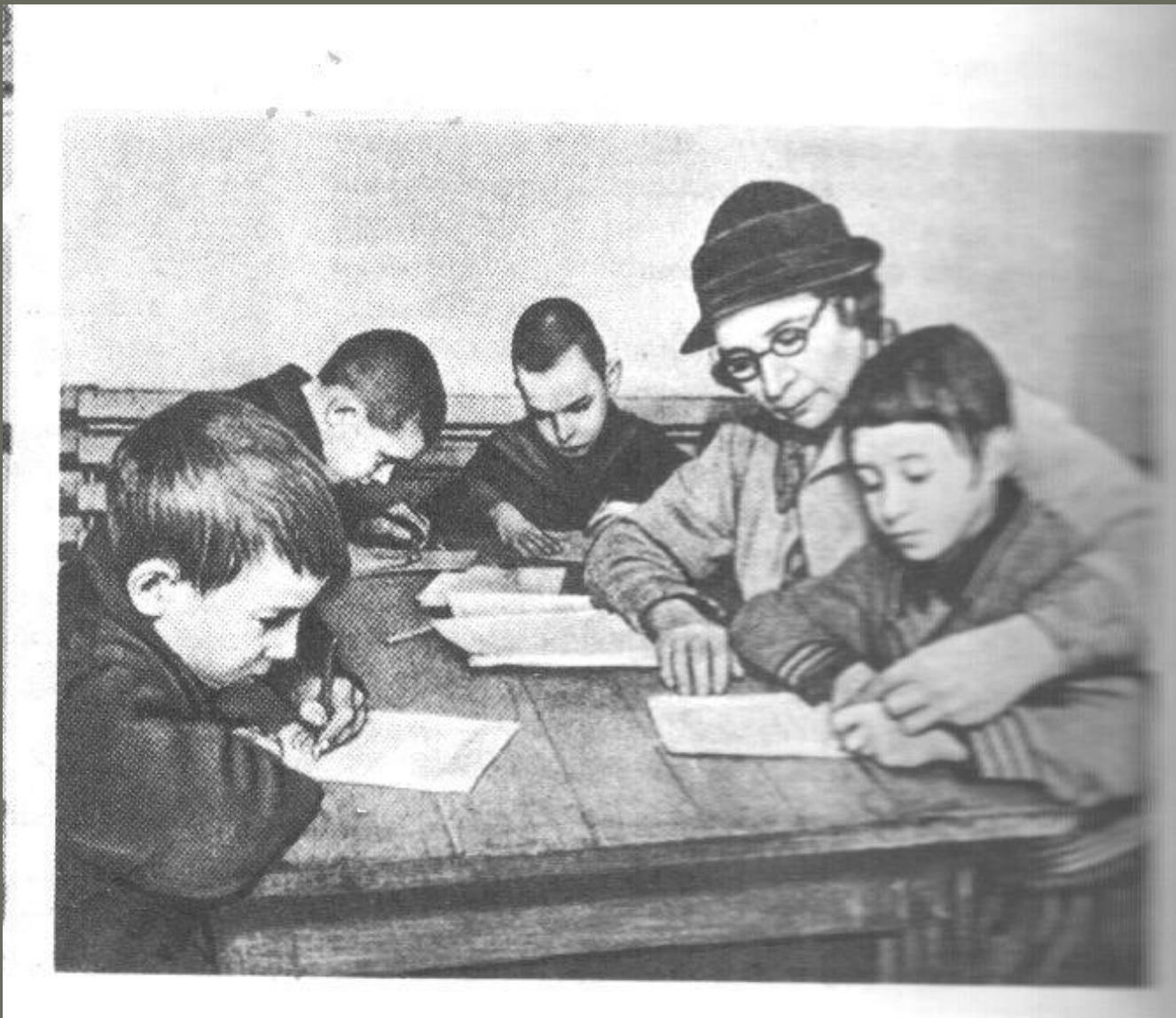
Занятия продолжаются. Школа в бомбоубежище. Декабрь 1941г.