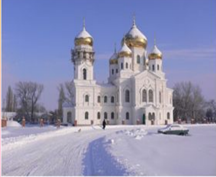
Свято-Троицкий Вознесенский собор, храм, Выселковский район Динской район (1914 г.)

Собор чудом уцелел. В 1933 году было решено использовать его под зернохранилище.