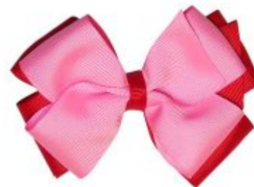
Бант какой? (розов ый )