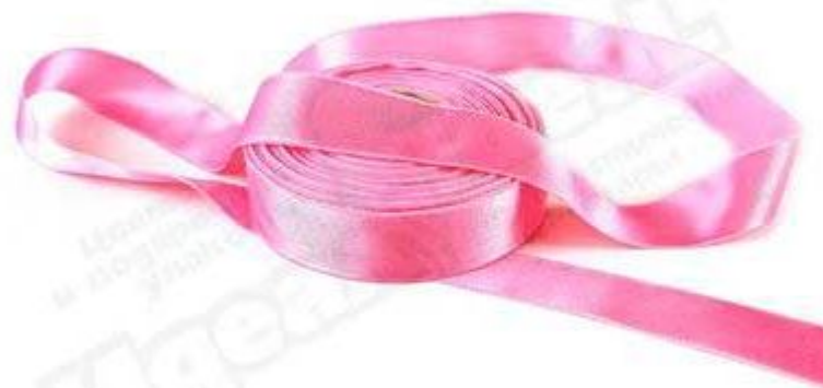
Лента какая? (розов ая )