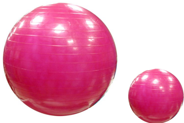
Мячи какие? (розов ые )