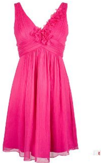
Платье какое? (розов ое )