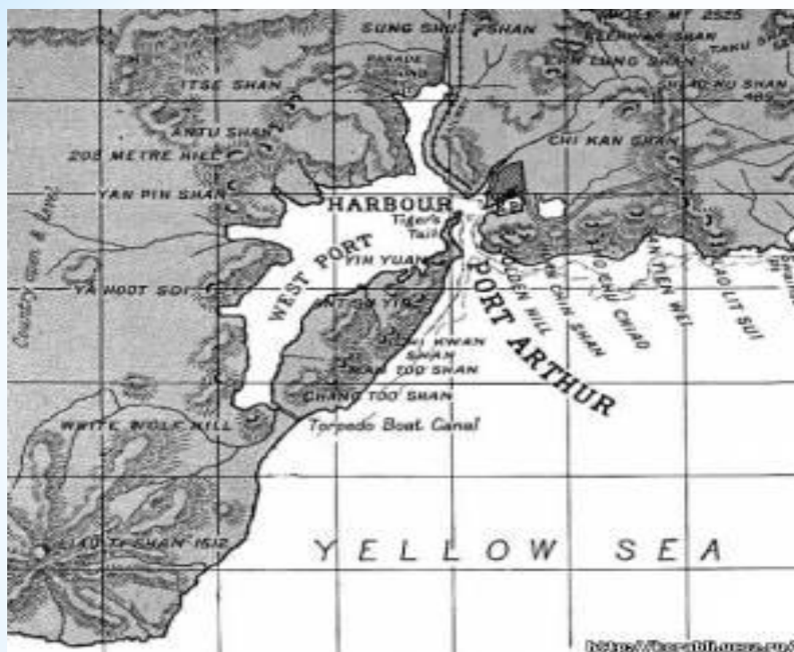
Порт-Артур на карте