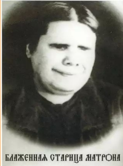
БЛАЖЕННАЯ СТАРИЦА МАТРОНА