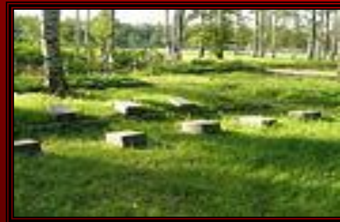
Пискаре́вское мемориальное кладбище