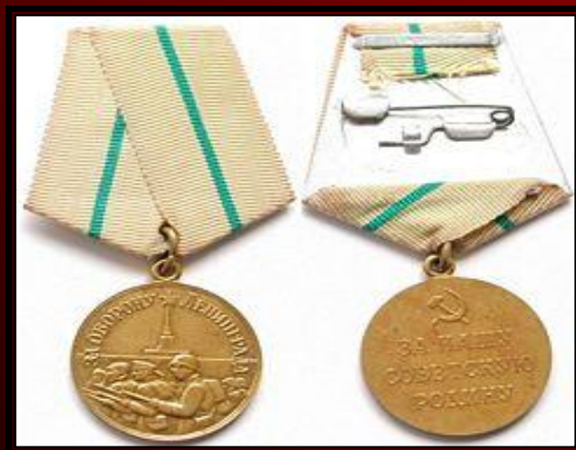
Медаль «За оборону Ленинграда»