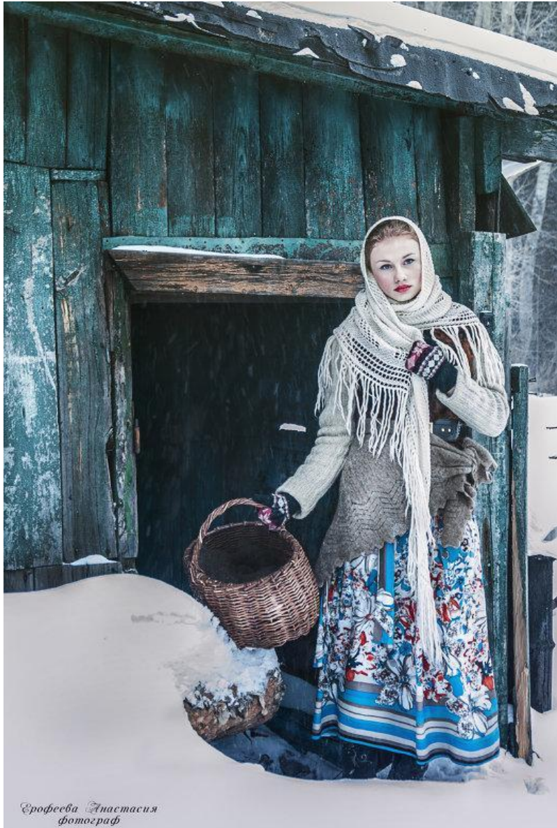
Ерофеева Анастасия фотограф