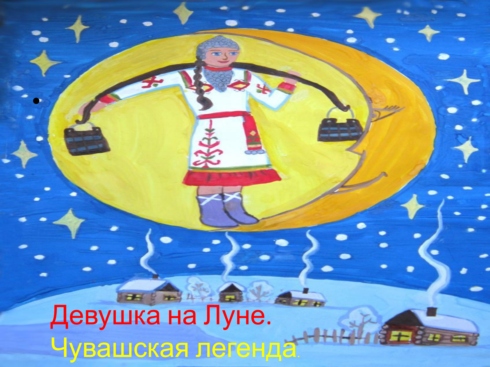
Девушка на Луне. Чувашская легенда.