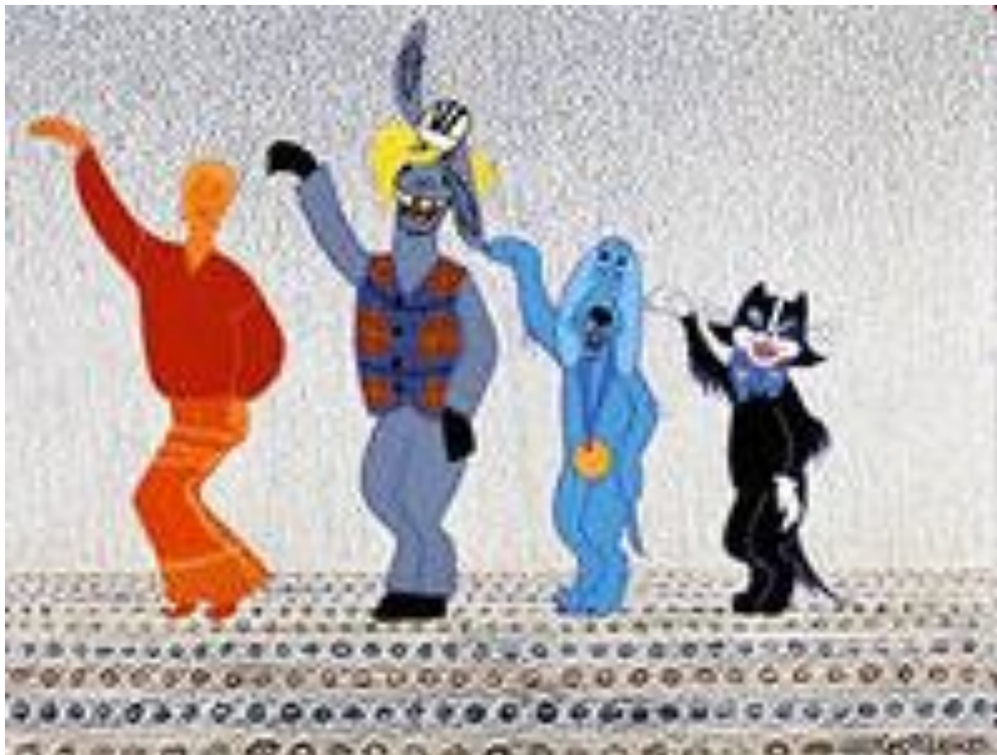
(Бременские музыканты: петух, кот, пес, осел.)