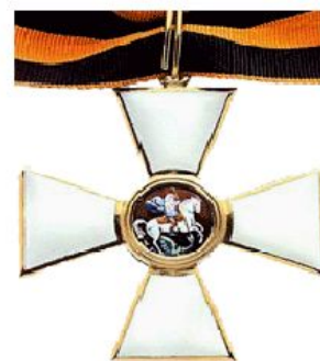
Орден Святого Георгия