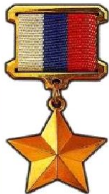
Звезда Героя Российской Федерации