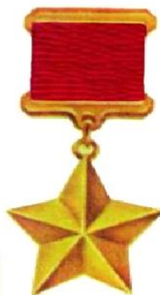
Звезда Героя Советского Союза

«Россияне, отмеченные почетным званием героев, достойны, чтобы у них был собственный праздник».