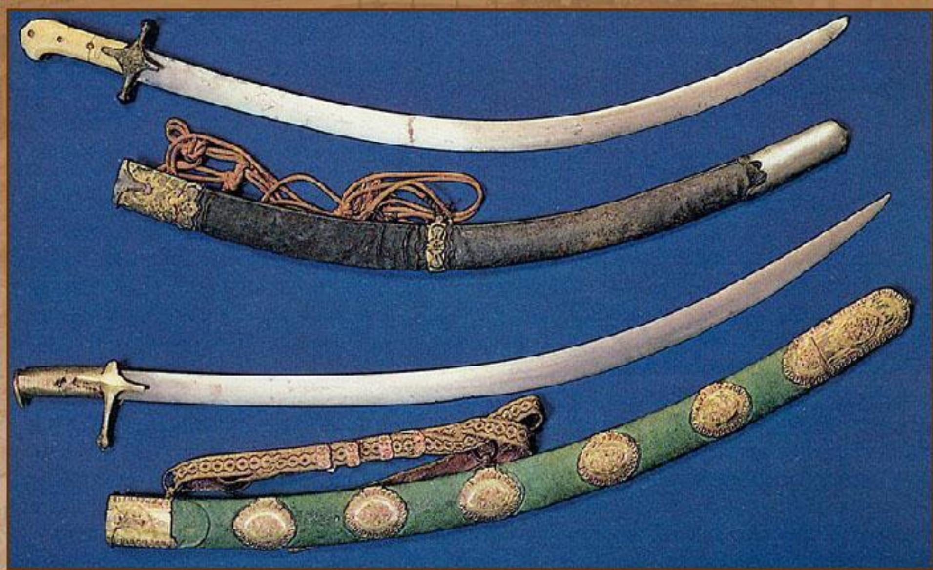
Сабли К. Минина и Д. Пожарского