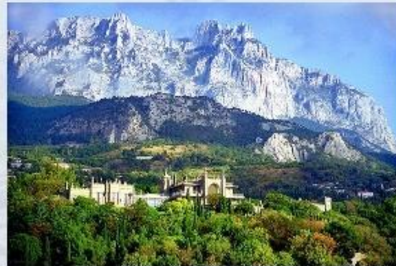
ЯЛТИНСКИЙ ГОРНО-ЛЕСНОЙ ЗАПОВЕДНИК