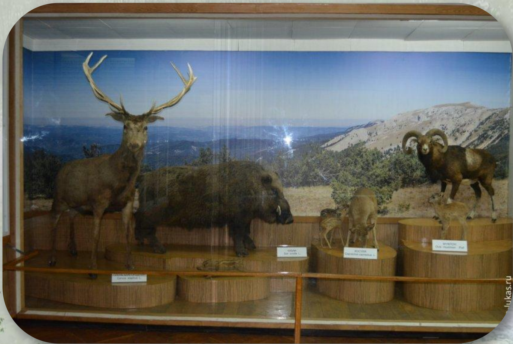
Карибу Caribou alpestris L.