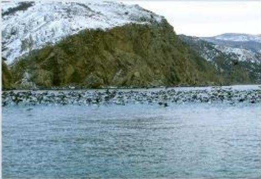
КРЫМСКИЙ ПРИРОДНЫЙ ЗАПОВЕДНИК «ЛЕБЯЖЬИ ОСТРОВА»