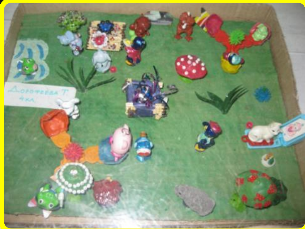
Выставка детского творчества