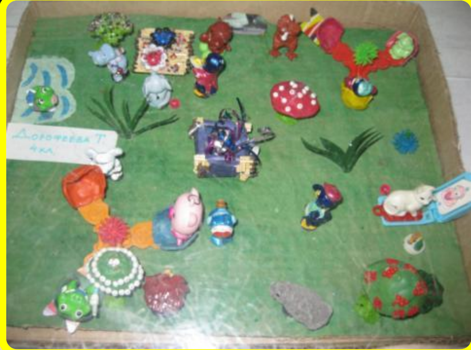
Выставка детского творчества