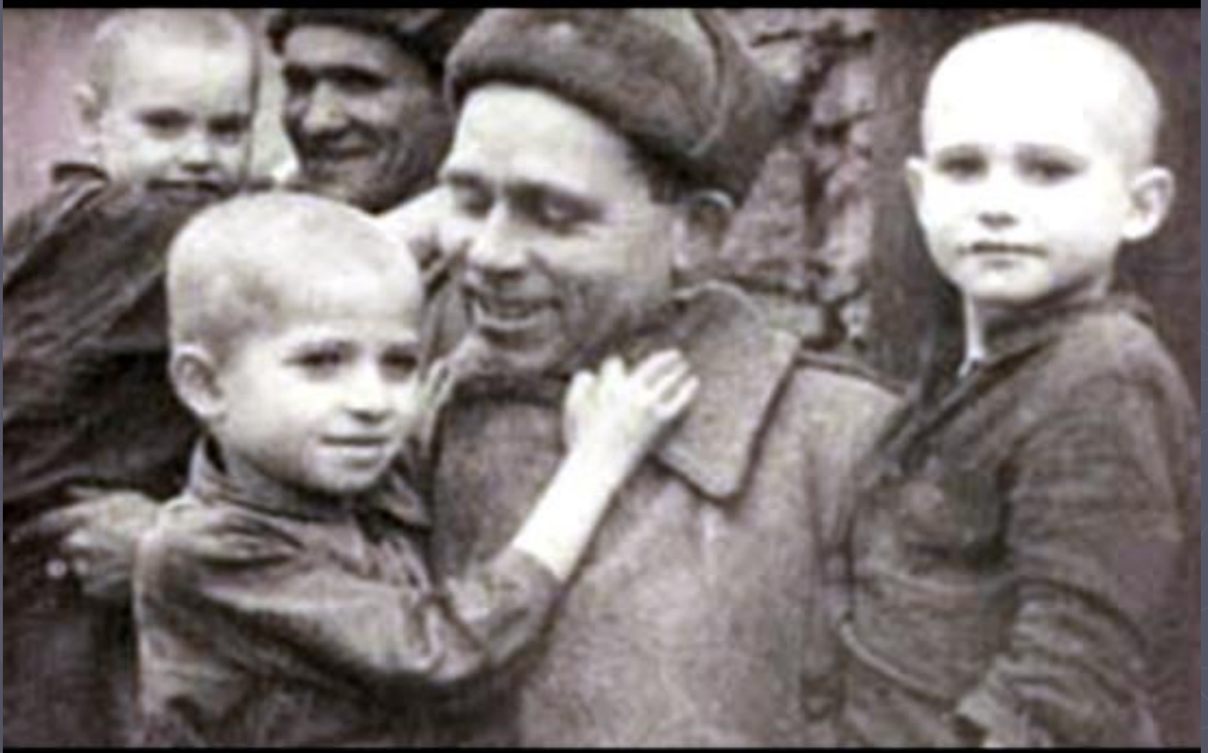
На фото: Освобожденные дети Саласпилса в 1944 г.

Замечая следы преступлений, фашисты ликвидировали лагерь в октябре 1944 г. Но свидетельства чудом выживших узников не люди уничтожить не смогли.