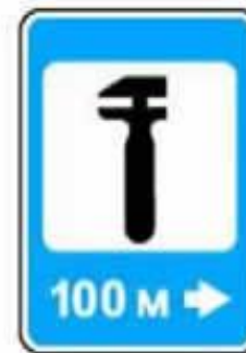
7.4 Техническое обслуживание автомобилей