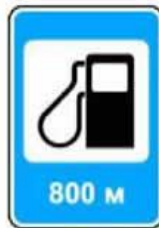
7.3 Автозаправочная станция