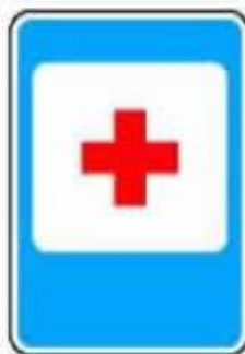
7.1 Пункт первой медицинской помощи