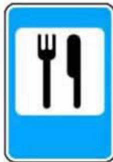
7.7 Пункт питания