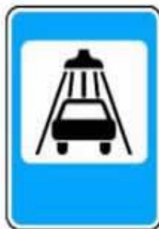
7.5 Мойка автомобилей