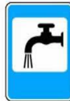
7.8 Питьевая вода